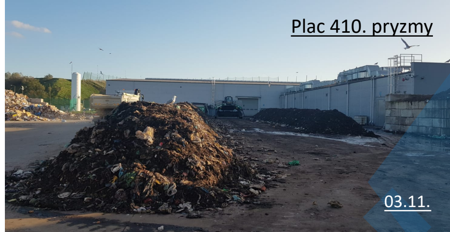
Plac 410. pryzmy